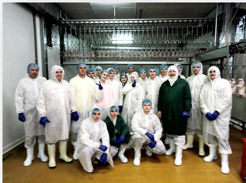
Підприємства харчової промисловості