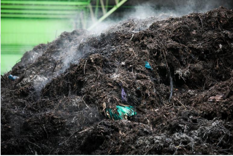
Компостування - добриво