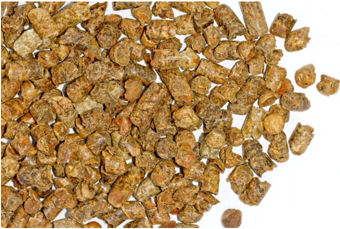
Корм для тварин