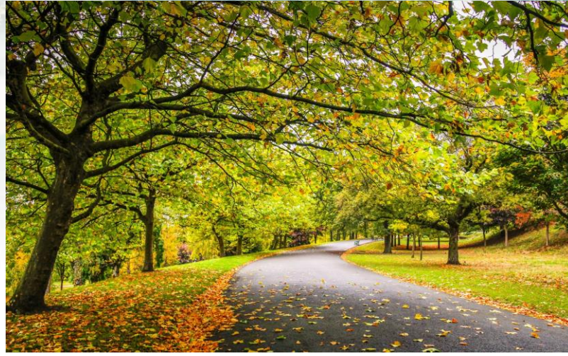
Швидке розкладання в природніх умовах