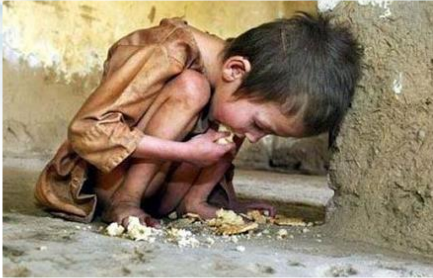
Кожин дев'ятий житель Землі голодує