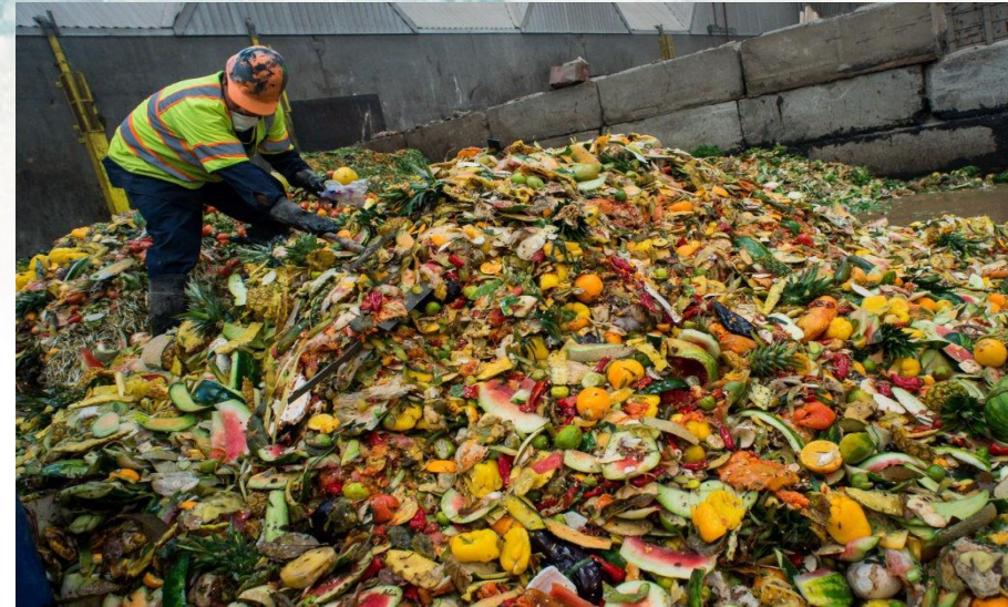
25% обсягу виробництва харчової продукції – харчові відходи та вторинна сировина.

Це призводить до економічних збитків - 1 трлн. дол. США.