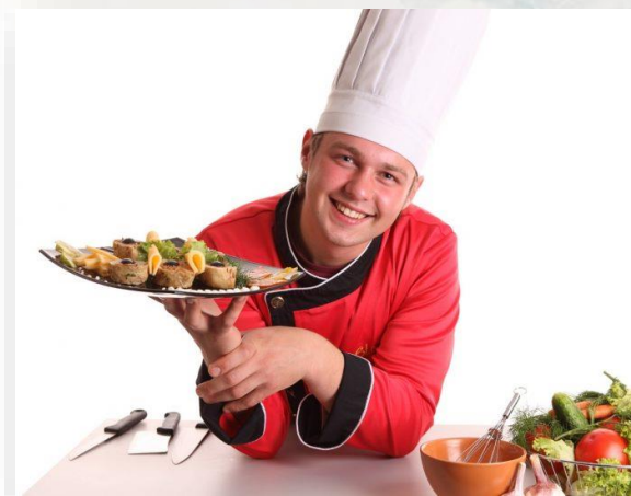
Заклади ресторанного господарства