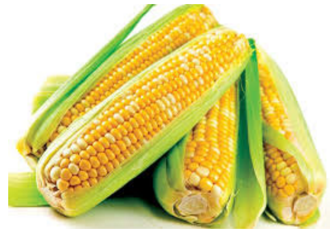
Використання кукурудзяних початків