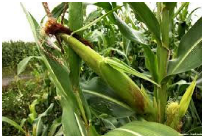
Використання бадилля кукурудзи