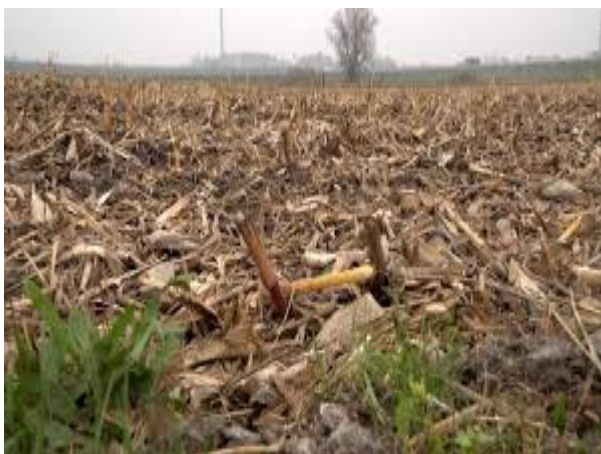
Використання відходів кукурудзи після збору врожаю